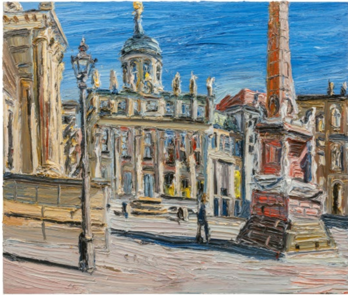
Alter Markt im Mittagslicht 2025, Öl auf Leinwand, 160 × 190 cm