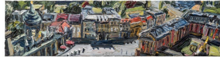
Alter Markt-Panorama 2025, Öl auf Leinwand, 50 × 200 cm