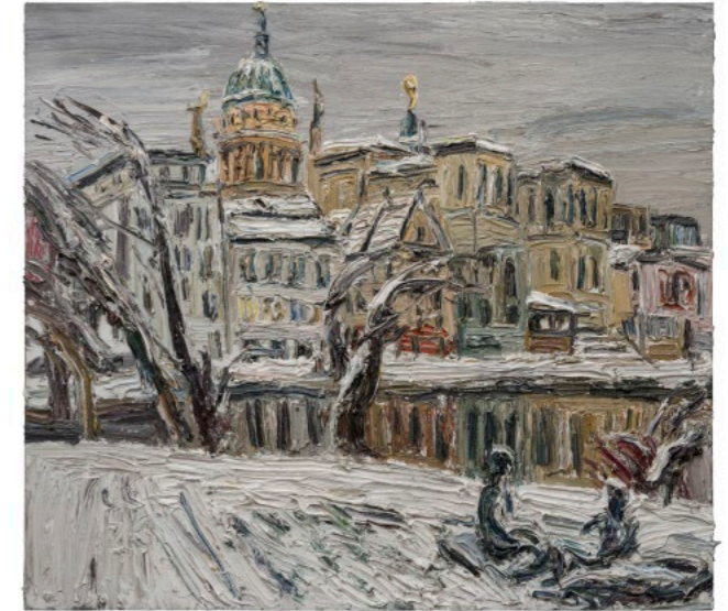
Wintertag an der Freundschaftsinsel 2026, Öl auf Leinwand, 150 × 170 cm