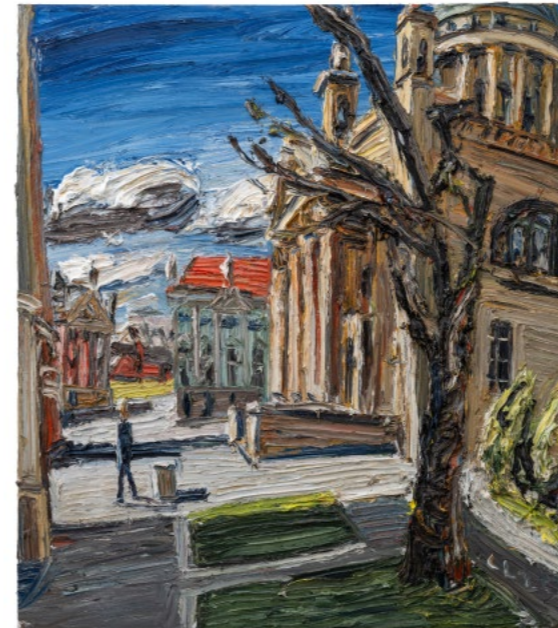
St. Nikolai, Potsdam 2025, Öl auf Leinwand, 170 × 150 cm