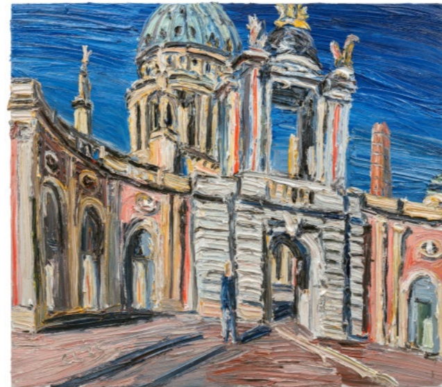
Am Landtag 2025, Öl auf Leinwand, 150 × 170 cm