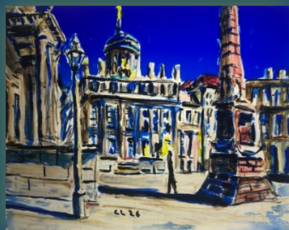
Sonniger Alter Markt Potsdam 2025, Glas, 50 x 40 cm