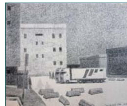
Kraftwagen, Mensch, Container, Haus, 2015, Kaltnadel, 22x15 cm (links) Drachholzstraße in Friedrichshagen, 2018, Ölfarbe, Leinwand, 45x50 (oben) Letschin, Oderbruch, 2017, schwarze Kreide, 40x50 cm (links unten) Am Zollamt Marzahn, Hellersdorfer Straße, 2017, schwarze Kreide, 40x50 cm