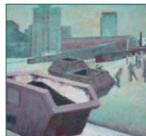
Container vor dem Hauptbahnhof, 2017, Ölfarbe, Leinwand, 32x35 cm